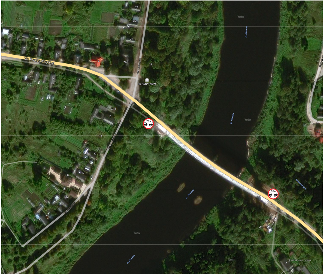
Схема расстановки дорожных знаков 3.16 «Ограничение минимальной дистанции» по ул. М. Горького и ул. К. Маркса, у моста через реку Ловать